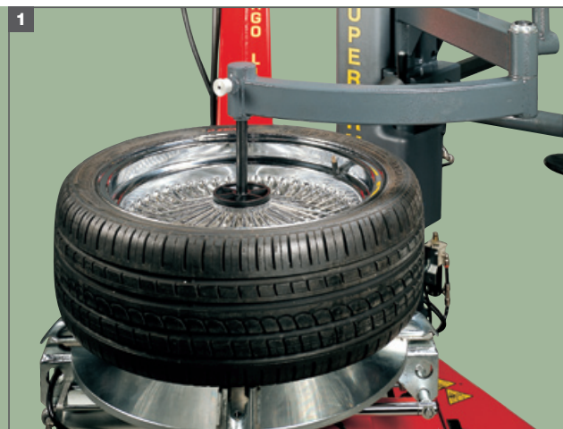
Foto AS963 completa degli optional Airtronic e del sollevatore ruota SL60 A. Photo of AS963 complete with optional accessories Airtronic and the wheel lifter SL60 A.

The bead breaking arm has a stroke of up to 410 mm and is fitted with stroke regulator to rule out the risk of crushing the tyre. The bead breaker is operated by a double-acting pneumatic cylinder made from 100% stainless steel, generating a power of 15500 N on the blade. The sliding bead breaker stop and roller way to support the tyre both protect the edge of the rim from the risk of damage and simplify the bead breaking procedure.